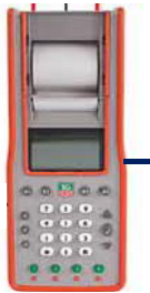
CP545 System A